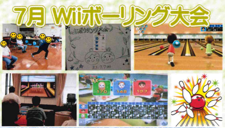
みなさん お上手です！ 腕をあげましたね！