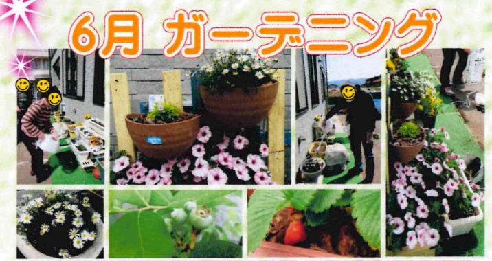
デイケアの花たちが、きれいに育ち実ってます。