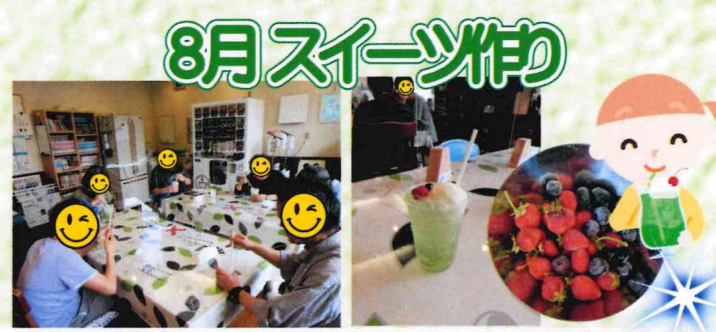
お手製のクリームソーダに、デイケア産のブルーベリーとイチゴをトッピング！美味しかったです(^_^)