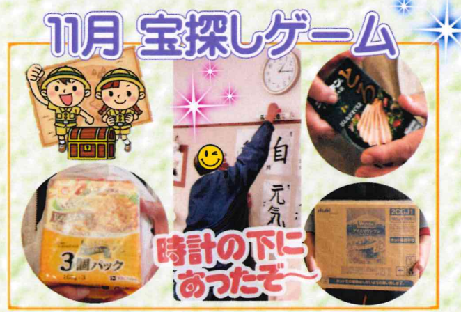
宝探しゲームって楽しいね！お宝ゲットで気分上々↑↑