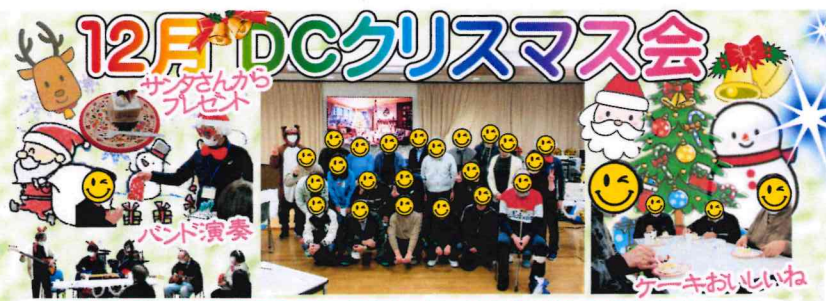
おいしいケーキにプレゼント。音楽クラブのバンド演奏も聞けたりして、楽しい X'mas会 でしたね♡