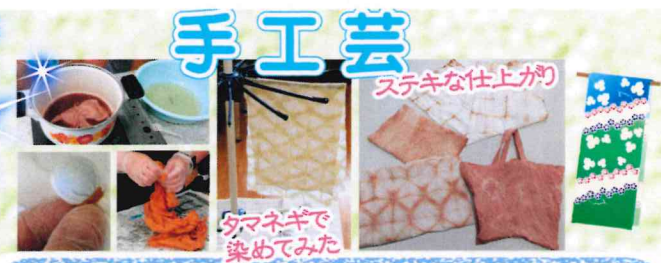
染め物って、途中段階は色合いと模様がどうなるか分からなくて、ステキな仕上がりに感動！