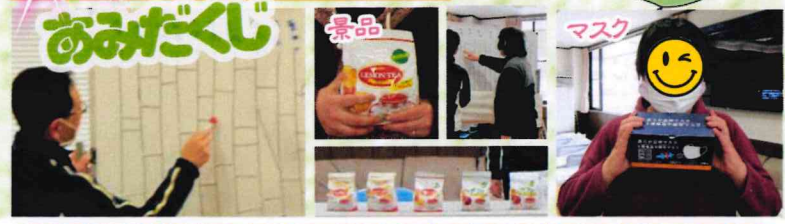
午前川柳年間大賞発表！受賞された方、おめでとうございます。午後は景品が当たる大おみだくじ大会など楽しそうでした。通所中の皆さん全員にコロナ禍の必需品マスクもプレゼント^^/1年間、お疲れ様でした。