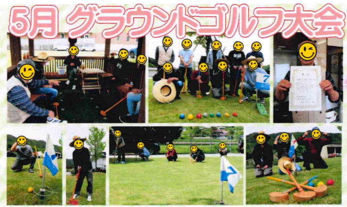
天気良好の大会日和。思う存分プレイできました。