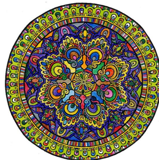
まんだら塗り絵 作:A氏