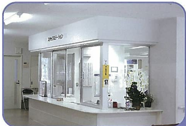
ナースステーション